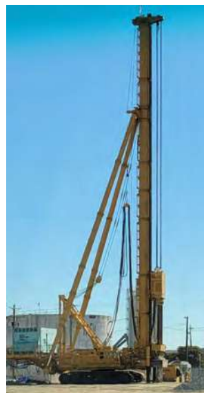
组装完毕的“大鸟”正在挖掘深坑，将钢筋和混凝土桩插入地下。