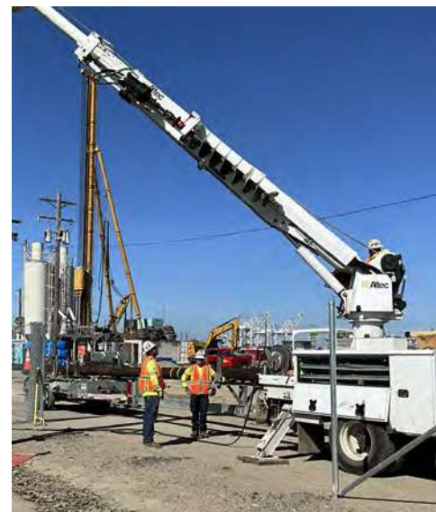
这台白色起重机用于安装一根新的 1,500 伏电线杆。