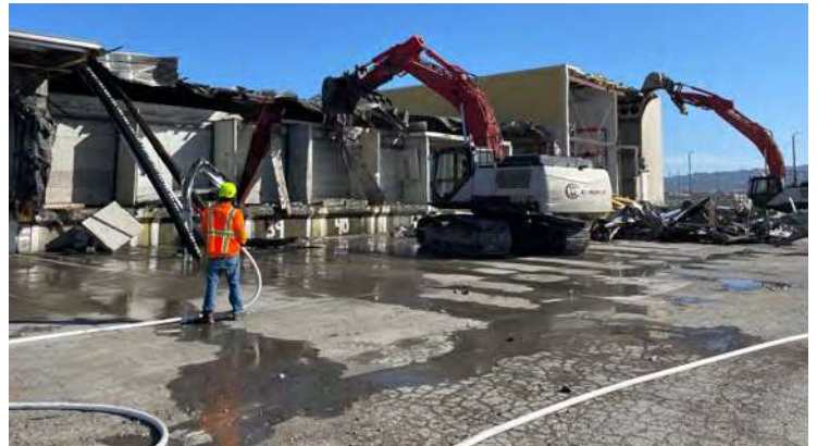
奥克兰港旧 PCC 物流大楼拆除工作进行中，为新的第 7 街道路让路